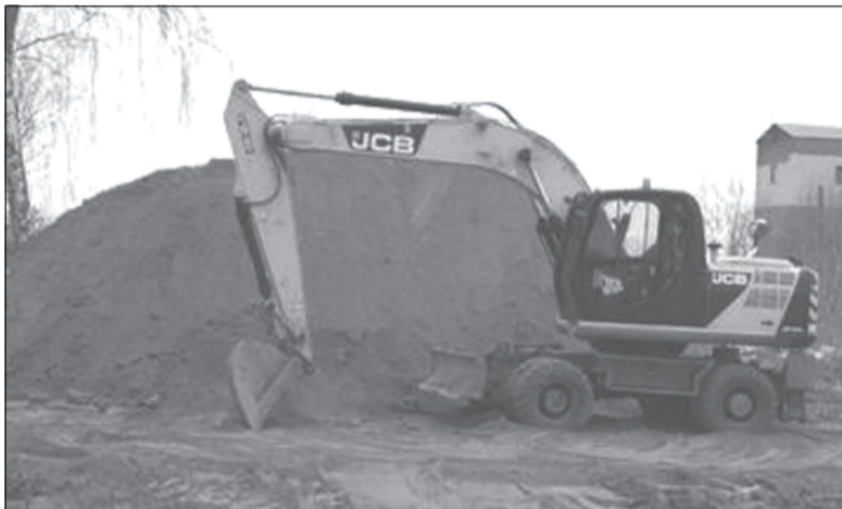
Завезены стройматериалы, которые будут использованы в ходе реконструкции городской площади

Нетрезвые компании, посиделки на природе с горячительными напитками постепенно уходят в прошлое. Сегодня у молодых в моде трезвость, спорт, позитивный настрой. Эти изменения бросаются в глаза в связи с появлением в городе современных общественных пространств.