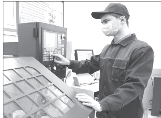
Создание особой экономической зоны даёт дополнительные возможности развития производства.

Как отмечено на коллегии, в 2020 году в целях улучшения инвестиционного климата и вхождения региона по данному показателю в число лидеров Национального рей-