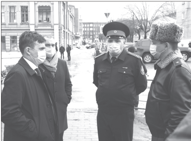
Станислав Воскресенский потребовал принять меры, чтобы не допустить повторения трагедии, произошедшей в Иванове.

Губернатор Ивановской области Станислав Воскресенский распорядился создать межведомственные комиссии с участием глав муниципальных образований и представителей МЧС, чтобы обследовать старые здания в Ивановской области, вне зависимости от того, в чьей собственности они находятся. Глава региона возложил цветы на месте гибели 20-летней девушки на улице 8 Марта в городе Иваново.