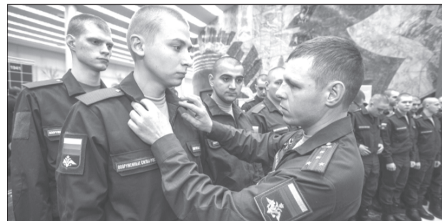
Работа призывных комиссий организована в соответствии с правилами эпидбезопасности.

Работа призывных комиссий и сборного пункта будет организована в соответствии с правилами эпидбезопасности. В их числе – использование средств индивидуальной защиты органов дыхания и антисептиков, социальная дистанция, термометрия, регулярная дезинфекция помещений. Также все