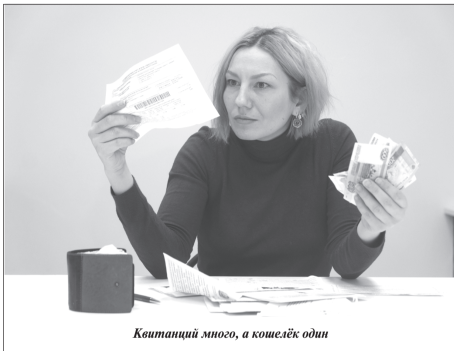
Квитанций много, а кошелек один