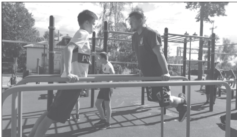
Эти парни всерьёз готовят себя к службе в армии

Наступила весна, в саду произошли изменения: снег сошёл и тут стало казаться ещё просторнее. Народа в будние дни мало, внук с радостью гоняет на самокате — дорожки из плитки чистые, нет ни ям, ни луж. После активных занятий мы садимся на скамейку. Ребёнок кормит голубей, пускает мыльные пузыри, а я просто сижу и смотрю вокруг. Любуюсь просторами сада, наслаждаюсь тишиной, чистым воздухом. Но не скажу, что всё мне здесь нравится. Конечно, главная проблема — это грачи. Ещё бы мне