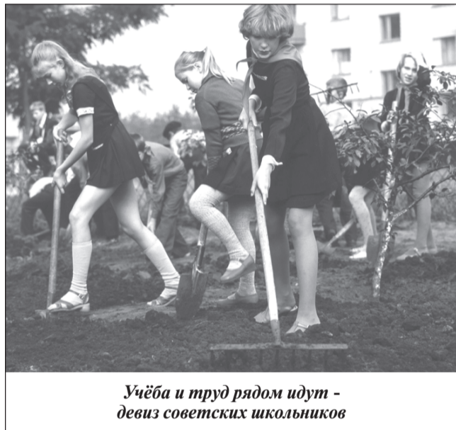
Учёба и труд рядом идут - девиз советских школьников

музей революционной, боевой и трудовой славы, кинотеатров». Но и это ещё не всё! Школьники продолжили свои подвиги и возвели спортивный комплекс! Как это было? Снова обратимся к строкам статьи: «... И про-