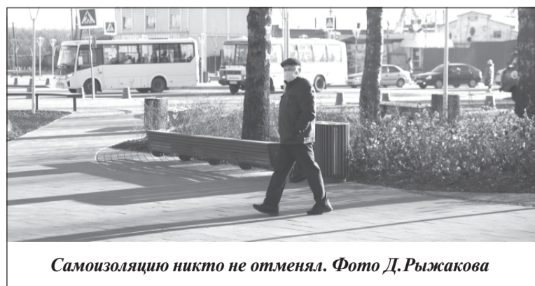
Самоизоляцию никто не отменял.

Временные правила оформления листов нетрудоспособности и назначения выплат по ним утверждены постановлением Правительства РФ. Больничные листы для работников в возрасте 65 лет и старше оформляют в тех регионах, где продолжают действовать ограничения в рамках режима повышенной готовности. В Ивановской области режим повышенной готовности действует в соответствии с указом губернатора Станислава Воскресенского с 18 марта 2020 года.