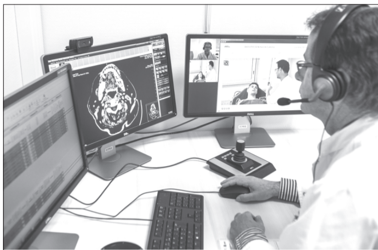
Пациент может получить консультацию у дежурного врача по видеосвязи