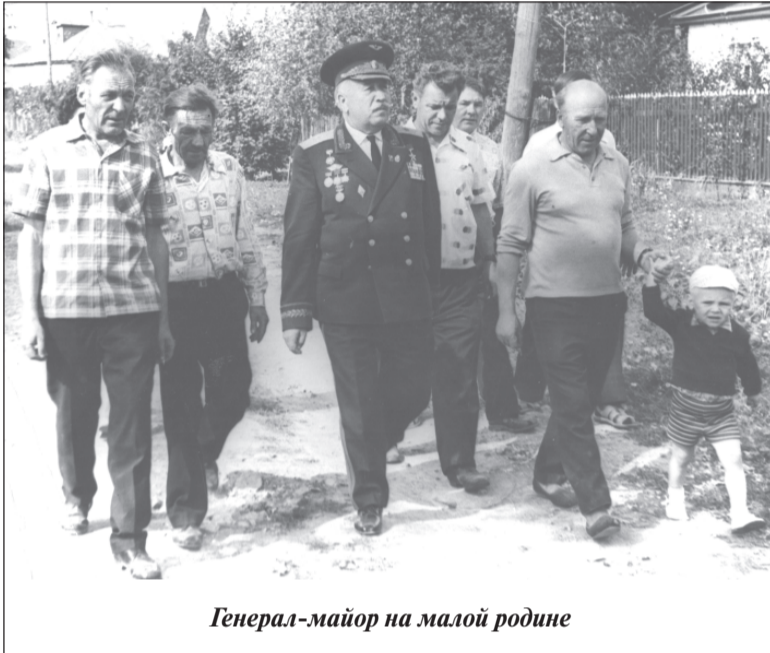
Генерал-майор на малой родине

Редакция благодарит за помощь в подготовке материала С.В. Комарова, Н.А. Махалова и А.П. Гусеву.